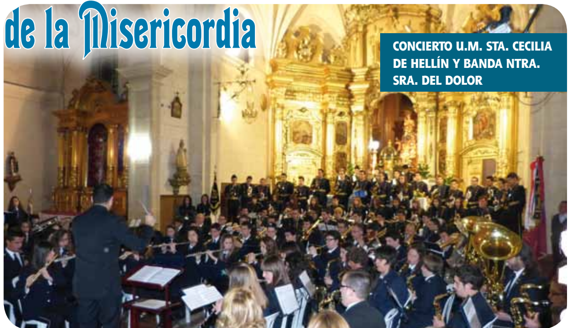
CONCIERTO U.M. STA. CECILIA DE HELLÍN Y BANDA NTRA. SRA. DEL DOLOR